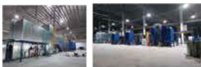
ガレージジャッキ 粉体塗装ライン