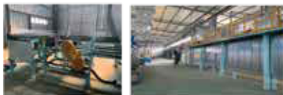
ドラム缶塗装乾燥ライン