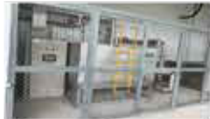
洗浄装置用 チラーシステム