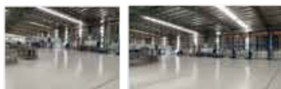
消火器の前処理ライン& 粉体塗装ライン