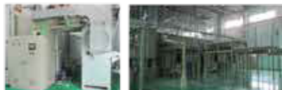
ミッションの前処理ライン& 塗装ライン