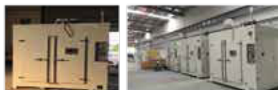
樹脂ファン羽のアニル炉