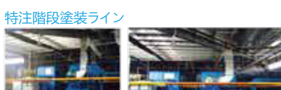
特注階段塗装ライン