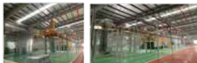
防火扉の塗装ライン