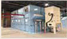
特注階段塗装ライン