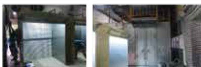
ミッション前処理ライン& 塗装ライン