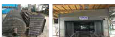
車ボディの塗装 焼付乾燥炉