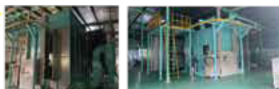
板金加工の粉体塗装ライン