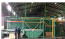
配管部品塗装ライン