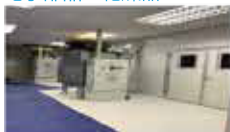
電子部品の乾燥器