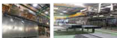
スタジアム用椅子塗装ライン