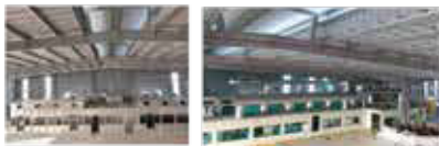
バイクのプラスチック部品塗装