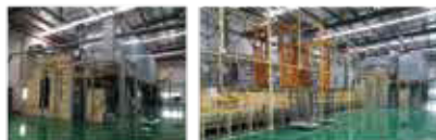
蝶番、ドア取っ手、ドア部品の前処理ライン& 塗装ライン