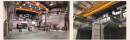
板金加工設備の塗装ライン 特殊トラックボディー塗装ライン